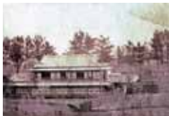
△ 明治24年撮影 臨江閣本館全景