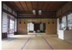
△ 臨江閣本館2階 △ 臨江閣本館1階